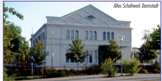
Altes Schalthaus Darmstadt

Get together , Freitag, den 16. März 2012 ab 19 Uhr im LCC Hotel, kostenlos.